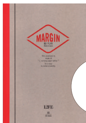
N701 MARGIN B5 無地

価格: 本体価格 1,100 円+ 税 単位: 5冊 サイズ: B5判 内容: マージン罫のみ 80枚