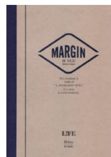
N712 MARGIN A5 横罫

価格: 本体価格 800 円+ 税 単位: 5冊 サイズ: A5判 内容: 横罫6ミリ×30行+マージン罫 80枚