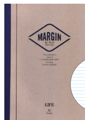
N702 MARGIN B5 横罫

価格: 本体価格 1,100 円+ 税 単位: 5冊 サイズ: B5判 内容: 横罫6ミリ×37行+マージン罫 80枚