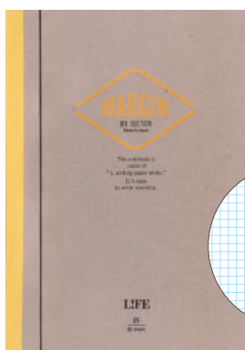
N700 MARGIN B5 方眼

価格: 本体価格 1,100 円+ 税 単位: 5冊 サイズ: B5判 内容: 5ミリ方眼+マージン罫 80枚