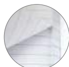
切り取り ミシン目入り