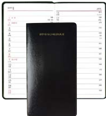
8B 黒 本革

価格: 本体価格 1,400円+税 単位: 1冊 サイズ: 138×75mm 内容: 革表紙